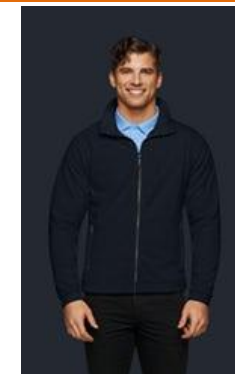
№ 605 Kapuzen-Sweatjacke Premium