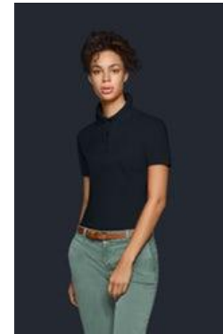
№ 126 Damen-V-Shirt Classic