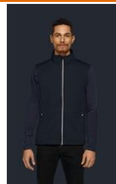
No 841 Fleece-Weste Toronto